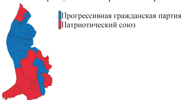
Рис. 1. Партии, занявшие первые места в регионах Лихтенштейна.

Тем не менее, можно выделить более и менее успешные для партий территории. Так, например, Прогрессивной гражданской партии удалось получить более 40% голосов в коммунах Маурен, Гамприн, Шелленберг, которые относятся к Верхнему Лихтенштейну. Для Патриотического союза, напротив, более высокие результаты (свыше 33%) характерны в коммунах Нижнего Лихтенштейна - Тризенберг, Бальцерс, Тризен, однако есть и исключения, например, 39,8% голосов партия получила в самой северной коммуне Руггель, которая относится к «верхнему» избирательному округу.